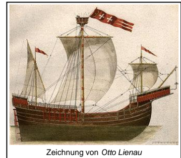
Zeichnung von Otto Lienau

Zweitens: Bei „Kraweel“/„Karweel“ handelt es sich um eine Beplankungsart und NICHT um einen Schiffstyp, wie z.B. Kogge, Karacke oder Galeone! Wohl gab es im 15. Jahrhundert ein berühmtes Schiff, „Dat grote Kraweel“, wobei sich diese Bezeichnung (es war eben nicht der Namen des Schiffes!) auf die Grösse des Schiffes und auf seine Beplankungsart bezog. Es war in jenem Jahrhundert das erste derart grosse Schiff im Ostseeraum, dessen Rumpf auf die Art und Weise beplankt worden war. Mit einer Länge ü.A. von etwa 51 m, einer Breite von ca. 12 m und einer Segelfläche von rund 760 qm an ihren drei Masten verdrängte das Schiff annähernd 800 t. Für die damalige Zeit muss ihr Anblick einen gewaltigen Eindruck auf die Menschen gemacht haben.